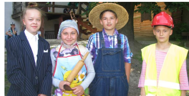
9 czerwca na Osadzie Rycerskiej bawiliśmy się na Pikniku Rodzinnym. Mnóstwo zdjęć z tego wydarzenia znajdziecie na szkolnej stronie www.