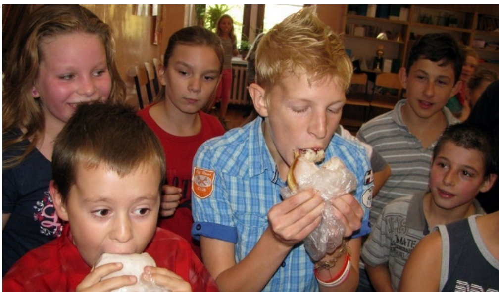
25 IX bawiliśmy się na dyskotecie z okazji Dnia Chłopaka. Muzyką, zabawa, taniec, konkursy – to jest to, co lubimy! Jeżeli chcecie, by muzyką towarzyszyła Wam podczas przerw – poproście o to Samorząd Uczniowski.